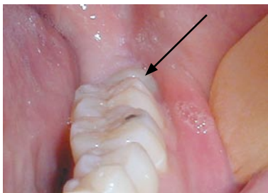
Bagest kan visdomstanden lige skimtes

Oftentimes er der kun plads til, at en del af visdomstanden bryder frem i munden. Såfremt den delvist frembrudte visdomstand ikke gør skade, er der ingen grund til at fjerne den.